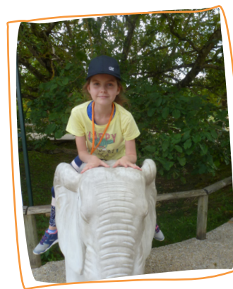
2019 3 e rêve Découvrir le Zoo de Beauval