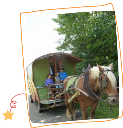
2015 1 er rêve Dormir dans une roulotte