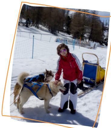
2017 2 e rêve Guider des chiens de traîneaux