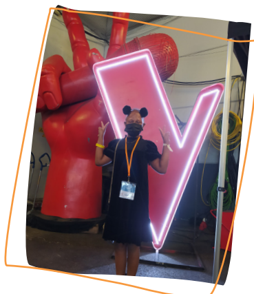
2021 1 er rêve Assister aux répétitions de The Voice