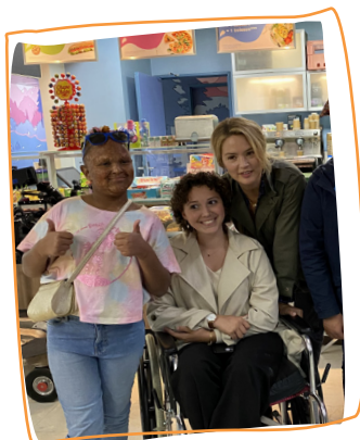
2022 2 e rêve Tournage d'une série