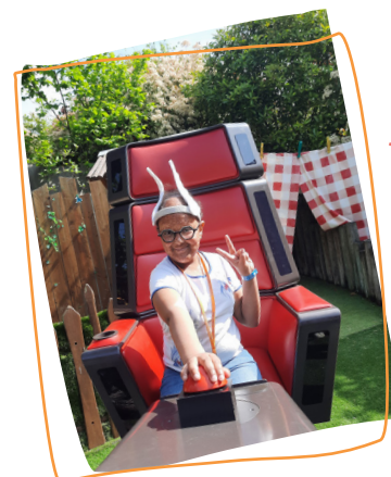
2023 3 e rêve Rencontre avec les Talents The Voice au Parc Astérix